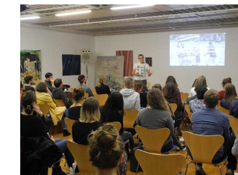
Podiumsdiskussionen, Workshops, Filmvorführungen etc.