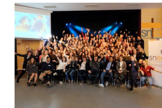
Gruppentreffen, sneep Tagungen